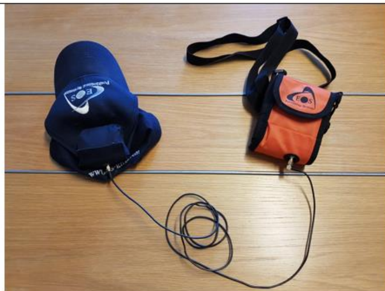
Utrustning efter montering

”Det är väldigt effektivt att använda plattan vid viss typ av inmätning. Vi mätte in fiberschakt längs med en väg och det gick 3 gånger snabbare med plattan än med traditionell mätutrustning med ”pinne””.