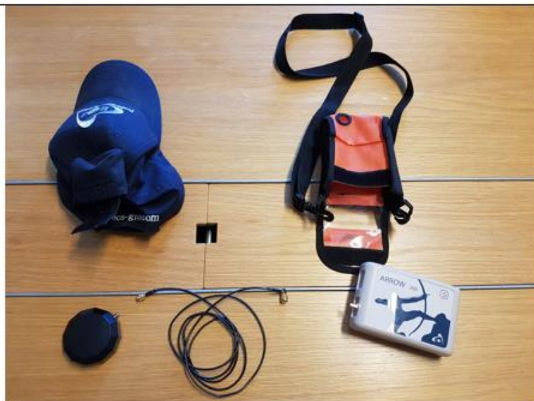
Utrustning före montering