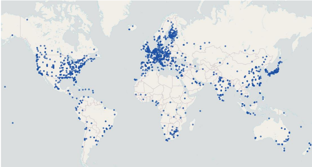
CUSTOMER LOCATIONS 2021